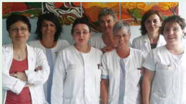
équipe ambulatorio Parkinson di Rovereto

Anche a Rovereto , la prima visita va prenotata tramite CUP ( 848 816 816 ) Per necessità e informazioni urgenti telefonare al numero 0464/403512 .